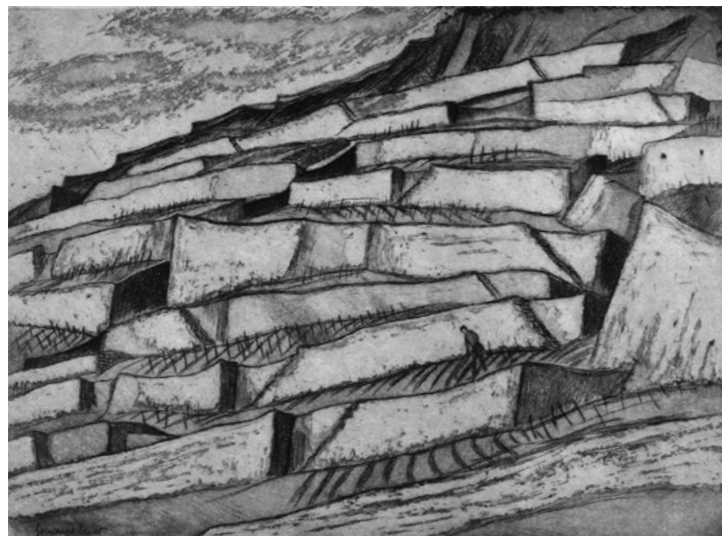
Germaine Ernst, Vignoble à la Crochetaz II (Au Dézaley) , 1974, eau-forte et aquatinte © Fondation Germaine Ernst, photo Claudine Garcia